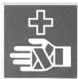
UNI 8133 - 6

UNI 8867 «Segnaletica specifica per piste da fondo - Caratteristiche».