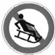
UNI 8135 - 2