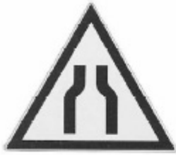
UNI 8136 1