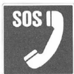
UNI 8133 - 7