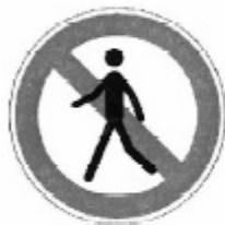
UNI 8135 - 1