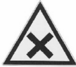
UNI 8136 2