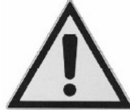
UNI 8136 3