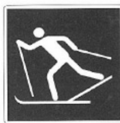
UNI 8133 - 9