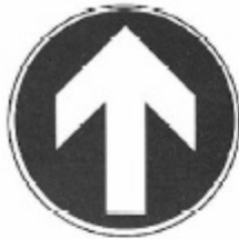
UNI 8134 - 9