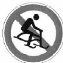
UNI 8135 - 3