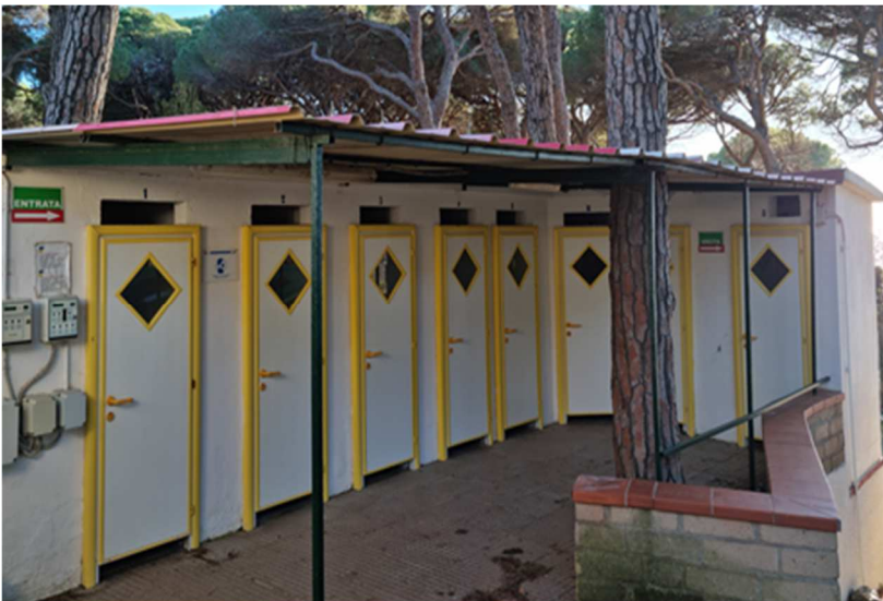
Figura 19. EDIFICIO P. Fabbricato in muratura - Docce in linea