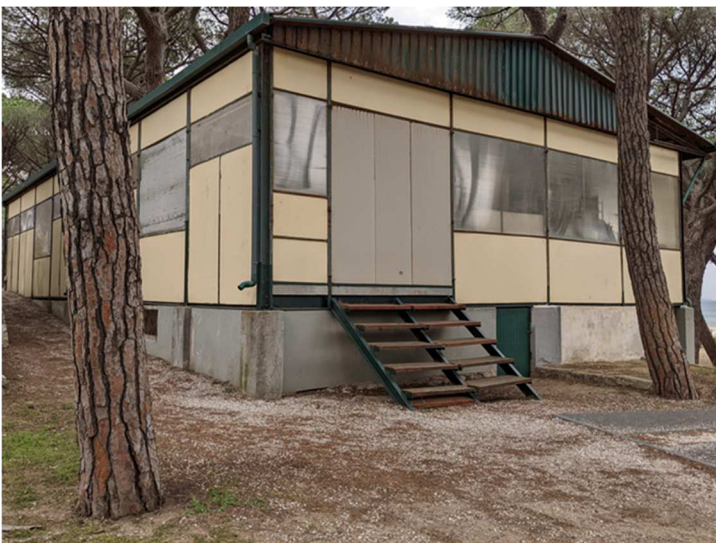
Figura 11. EDIFICIO I. magazzino e attività polivalenti