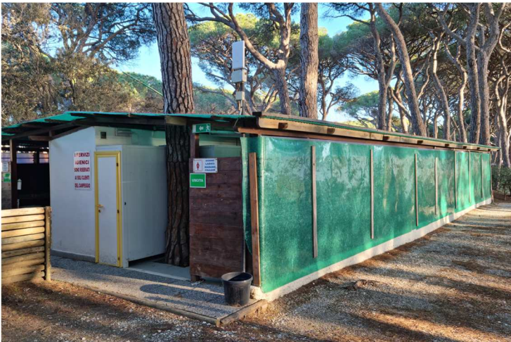
Figura 10. EDIFICIO H. Servizi igienici