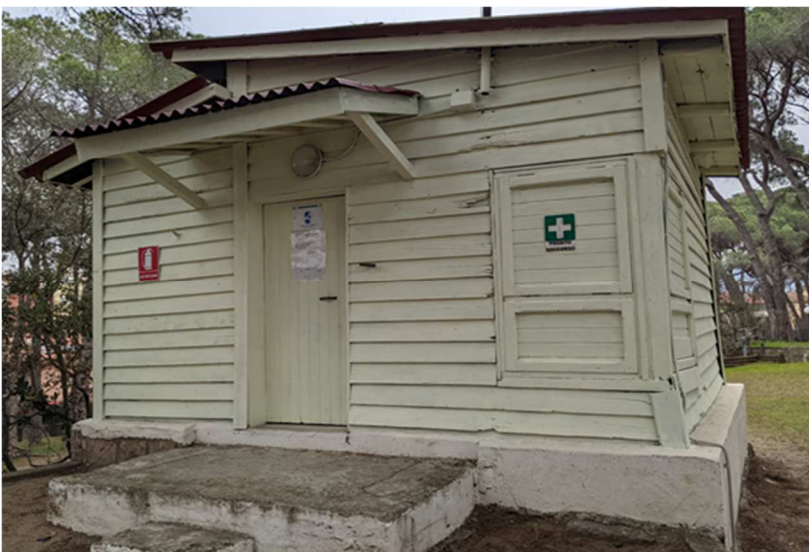
Figura 20. EDIFICIO Q. Infermeria