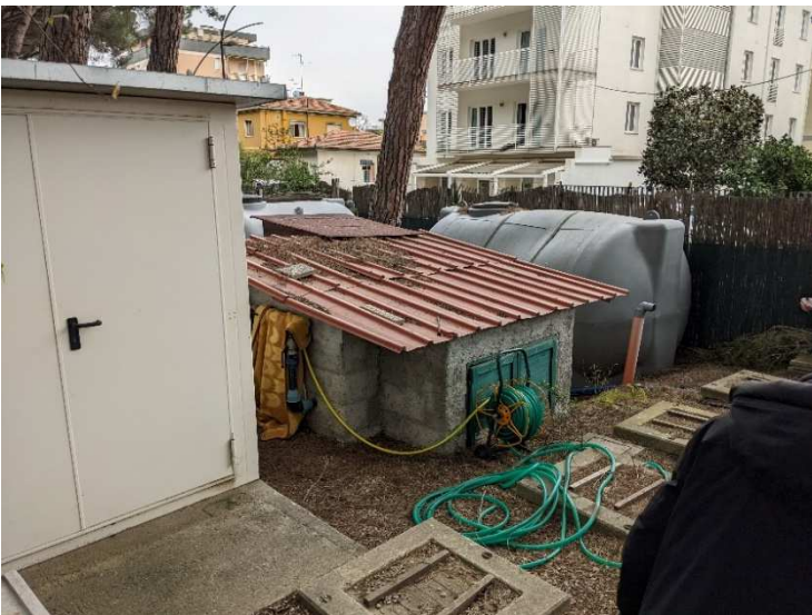
Figura 4. Area B