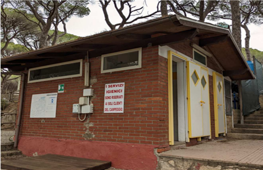
Figura 18. EDIFICIO O. Locale docce