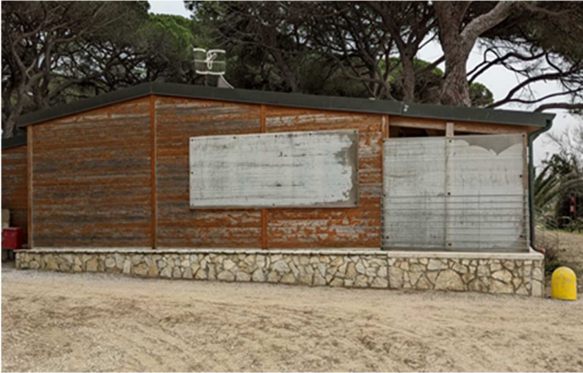
Figura 15. EDIFICIO M. Bar spaghetti visto da altra angolazione