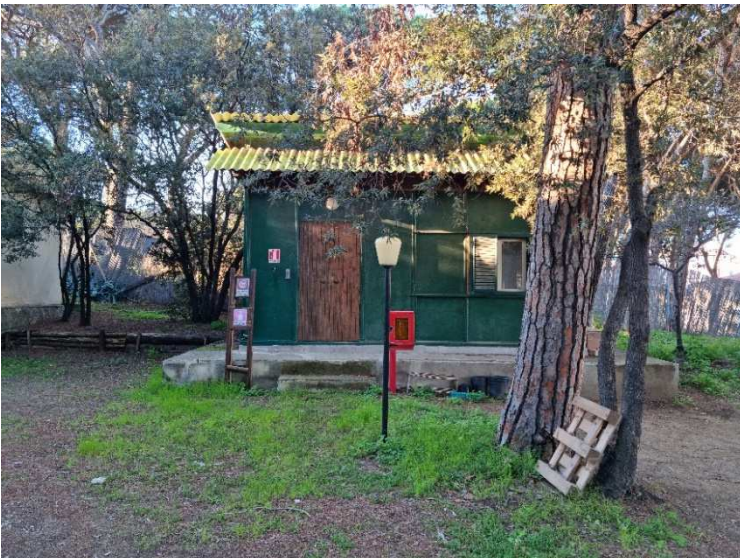
Figura 5. EDIFICIO C. ex alloggio guardiano