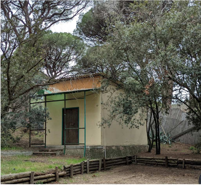
Figura 6. EDIFICIO D. Magazzino