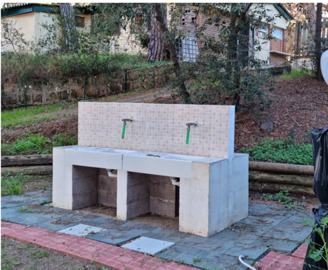
Figura 17. EDIFICIO N2. servizi per lavaggio