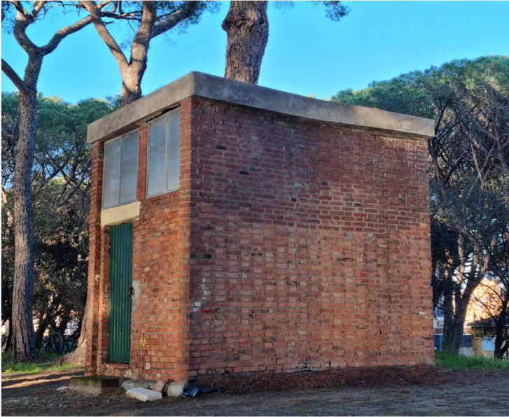
Figura 9. EDIFICIO G. Magazzino