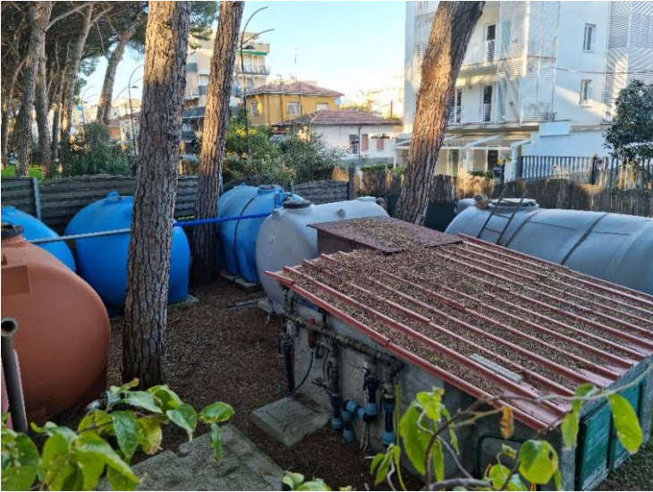
Figura 3. Area B. Depositi idrici, pompa e impianto antincendio