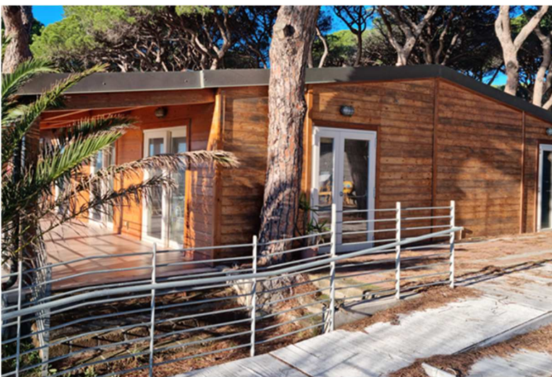
Figura 14. EDIFICIO M. Bar spaghetteria