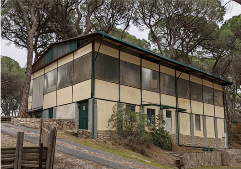
Figura 12. EDIFICIO I. Magazzino e attività polivalenti