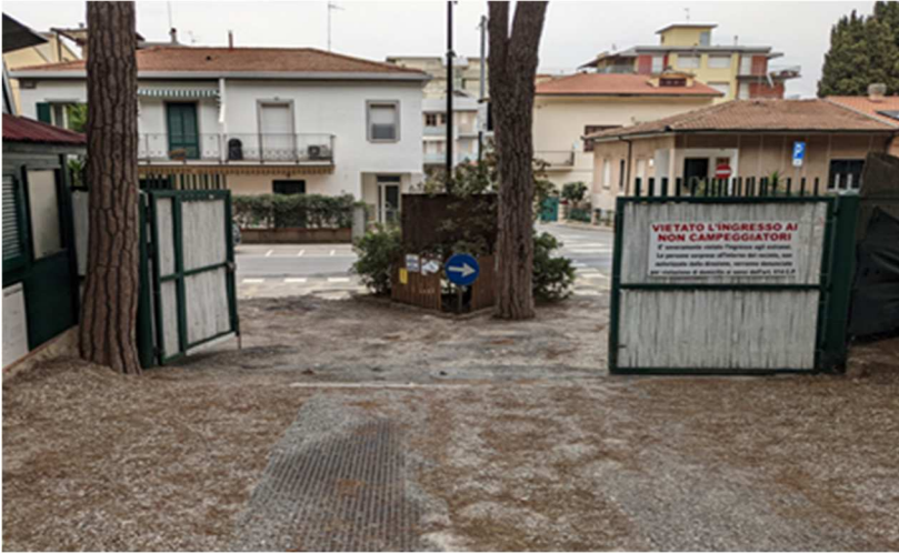
Figura 21. AREA S. Ingresso - uscita dal campeggio