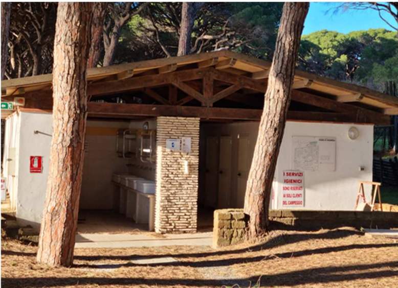
Figura 13. EDIFICIO L. Servizi igienici