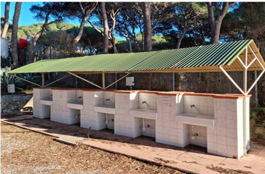
Figura 16. EDIFICIO N1. servizi per lavaggio stoviglie con tettoia