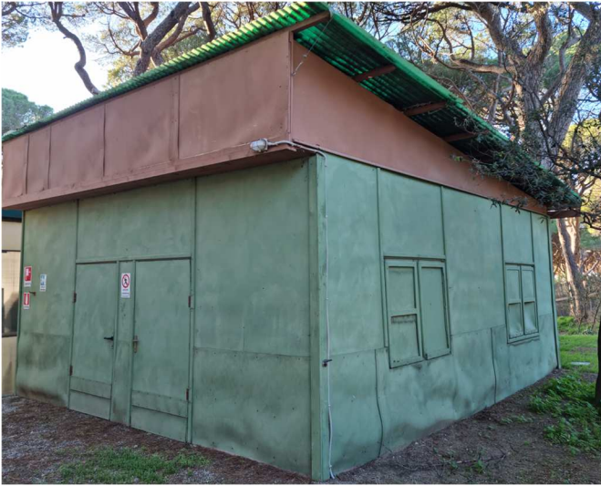
Figura 7. EDIFICIO E. Magazzino