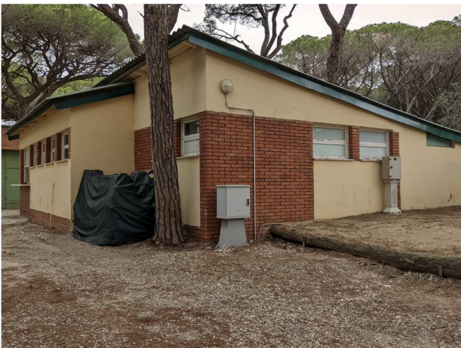
Figura 8. EDIFICIO F. Magazzino