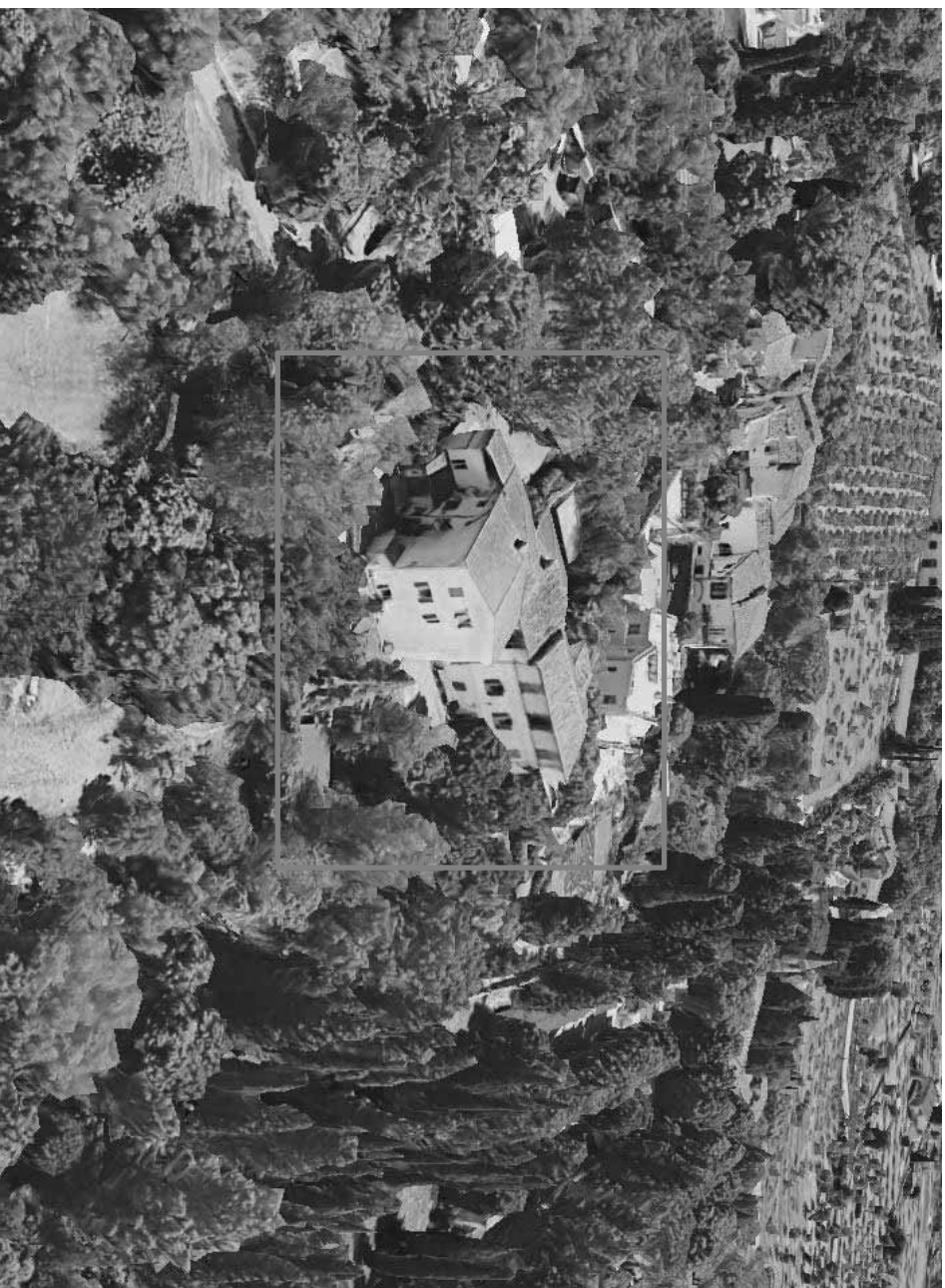
Fig. 3 – Vista aerea di Villa Reale di Castello, Centro Carabinieri Cinoftli