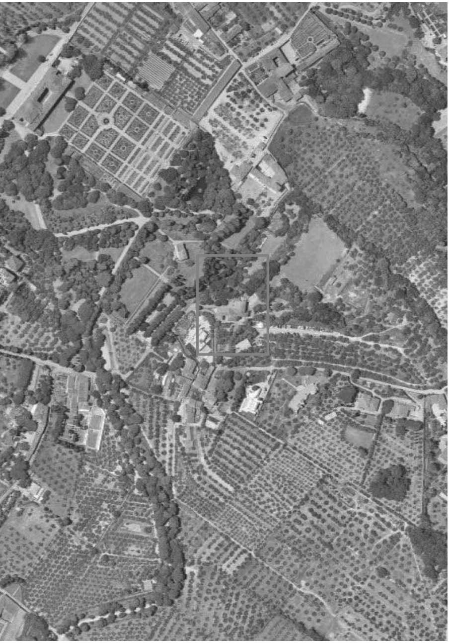
Fig. 1 – Vista aerea con ubicazione di Villa Reale di Castello, Centro Carabinieri Cinoffi

Il presente Annesso descrive l'oggetto dell'affidamento del servizio di architettura e ingegneria relativo alla “Valutazione di sicurezza/vulnerabilità sismica – di seguito “ Verifica Sismica ” – e alla progettazione degli interventi di ristrutturazione della Villa Reale di Castello - sita in via San Michele a Castello 13, Firenze, presso il comprensorio del Centro Carabinieri Cinoffi - di seguito “ progettazione ” disciplinata dal combinato disposto dell'art. 41 e dell'Allegato I.7 del D.Lgs. 36/2023 e s.m.i.