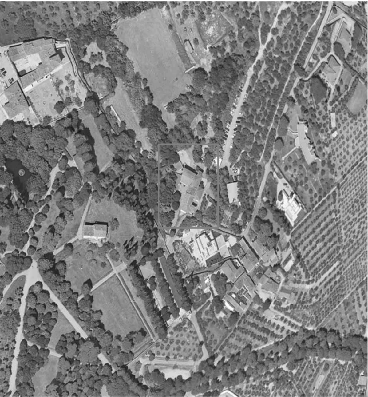
Fig. 2 – Vista aerea di Villa Reale di Castello, Centro Carabinieri Cinofili