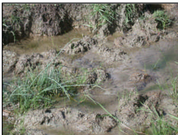
Sorgente del Fiume Sangro

Nel corso della seconda guerra mondiale le alture della riva sinistra facevano parte della linea Gustav e nel novembre 1944 furono teatro di aspri combattimenti fra forze inglesi e tedesche.