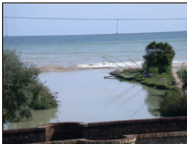
Foce del fiume Sangro