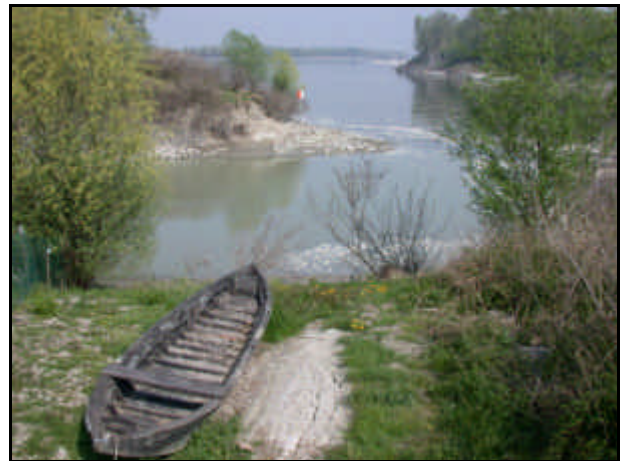
Confluenza del fiume Panaro