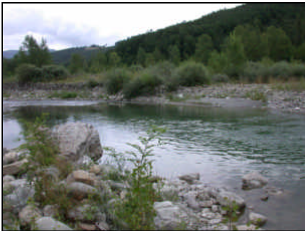
Sorgente del fiume Panaro

Nasce a valle di Cutigliano a valle di Bondeno con l'unione dei torrenti Leo e Scoltenna. Affluente di destra del fiume Po a Malcantone. Lung. km148. Affluente di sinistra: torrente Lerna, canale Naviglio, torrente Tiepido; di destra: canale Foscaglia, rio Rivella. Costeggiato dalla strada Stellata-Bondeno-Finale Emilia-Navicella-S. Donnino di Nizzola-Vignola-Fanano.