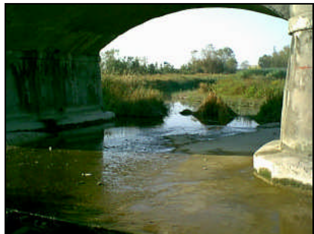
Foce del fiume Metauro