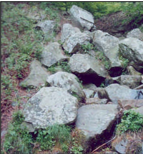
Sorgente fiume Brembo

Provincia di Bergamo. Nasce dalle Alpi Orbie in vari rami che si riuniscono a Lenna (San Martino dei Calvi). Affluente di sinistra del fiume Adda a Crespi, presso Brembate. Costeggiato dalla foce a Villa d'Almè da varie strade di secondaria importanza e, da Villa d'Almè a Piazza Brembana, dalla SS. 470. Affluenti, di sinistra: torrente Ambria, torrente Borleggia, torrente Gionco, torrente Parina, rio di Pegherolo, torrente Quisa, torrente Val Secca, di destra: torrente Brembilla, torrente Dordo, torrente Enna, torrente Imagna.