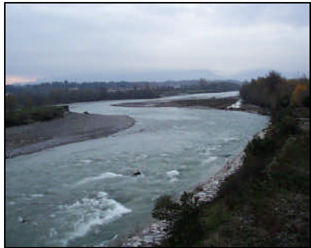
Confluenza nel fiume Adda