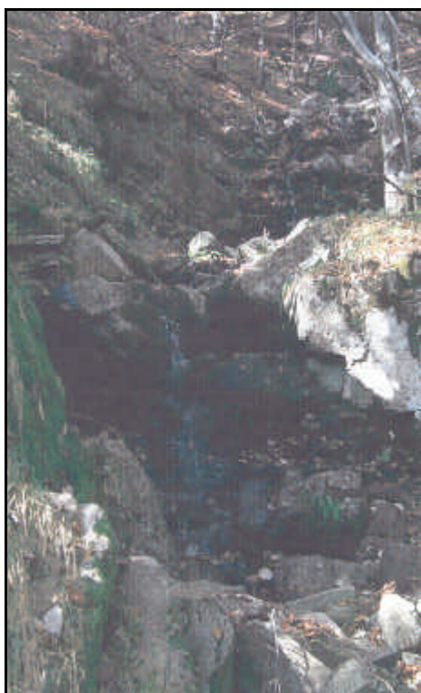
Sorgente del fiume Vara

Il corso inferiore del fiume, a valle di Ponte S.Margherita, presso il Sesta Godàno, è oggi interessato dall'unico Parco fluviale regionale, volto non solo alla tutela delle acque e di un ambiente eccezionale per la Liguria, ma anche al ripristino ambientale e paesaggistico della valle del Magra, utilizzata da decenni in maniera irrazionale e deturpante.