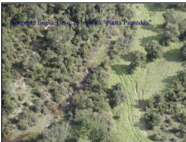
Sorgente fiume Tirso

Fiume della Sardegna, il più lungo dell'isola; 150 km; bacino: 3.375 km 2 . Nasce sull'altopiano granitico di Buddusò, a 800 m d'altezza; scende (dapprima con il nome di Riu de su Campu) attraverso il Goceano, con direzione NE-SO, ricevendo le acque di numerosi provenienti dal massiccio del Gennargentu dalle Barbagie, e dalla catena del Marghine. Il regime è torrentizio, caratterizzato da notevoli variazioni tra le massime invernali (febbraio) che raggiungono i 3.000 m 3 /s e le portate minime estive (agosto), ridottissime; proprio per regolare e disciplinare il regime del fiume, evitando le disastrose piene del passato, nel 1923 venne costruito il lago- serbatoio artificiale Omodeo, mediante sbarramento del fiume nel tratto mediano del suo corso (grandiosa diga del Tirso, detta di Santa Chiara, a ovest di Ula Tirso). La portata media attuale è di 4,28 m 3 /s. A valle di Fordongianus, il Tirso entra nel Campidano di Oristano, attraversando la sua vasta pianura alluvionale, bonificata; sfocia nel mar di Sardegna con un piccolo delta. Il bacino del Tirso, con 80.000 kW, fornisce la maggior potenza della Sardegna; le centrali più importanti sono quelle installate lungo il corso del Taloro (53.000 kW complessivi).