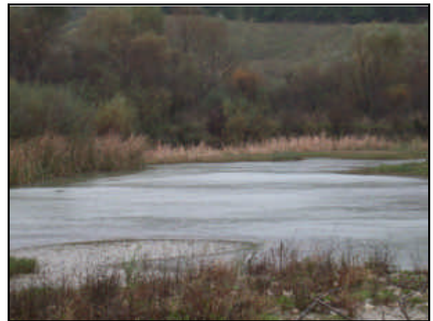
Foce del Fiume Tappino