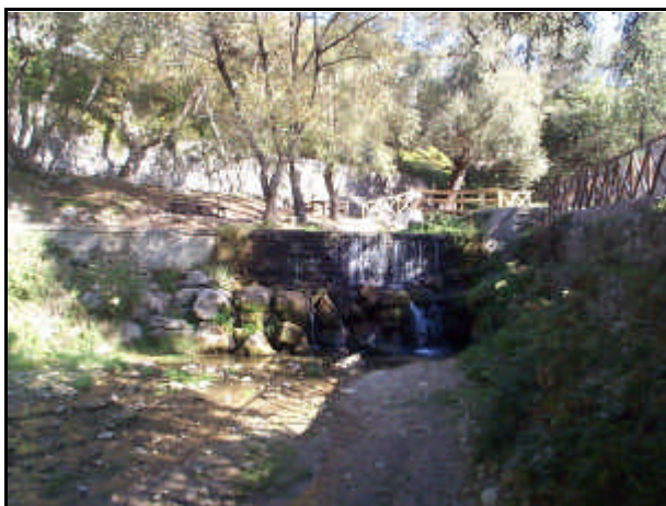
Sorgente del Fiume Sele

Fiume della Campania che sfocia nel golfo di Salerno; 63,6 km; bacino: 3.220 km 2 . Ha origine nell'Irpinia, dal monte Paflagone, contrafforte del monte Cervialto, da ricche polle carsiche, la più abbondante delle quali, ossia quella inferiore, sgorgante a 420 m d'alt. presso Caposele (prov. Avellino), viene dedotta e incanalata nel grande Acquedotto pugliese; scorre in direzione N-S fino a valle di Contursi, dove, ingrossato dall'apporto del Tanagro (sinistra) si volge verso SO, ricevendo, a valle di Persano, il Calore Lucano (affluente di sinistra), che gli reca il tributo delle acque del versante occidentale dell'Alburno e di parte dei monti del Cilento. Il fiume sfocia infine nel golfo di Salerno, attraversando una grande e fertile pianura alluvionale, la piana del Sele; quest'ultima, un tempo pianura litoranea malarica e paludosa, venne sottoposta a bonifica (prima per colmata, poi idraulica e integrale) che, potenziata dopo la legge Baccarini del 1882 e soprattutto nel periodo fra le due guerre mondiali, dopo il 1936, fu continuata dopo la seconda guerra mondiale, con l'appoggio della Cassa per il Mezzogiorno.