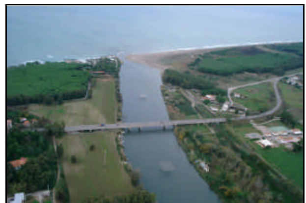
Foce del Fiume Sele