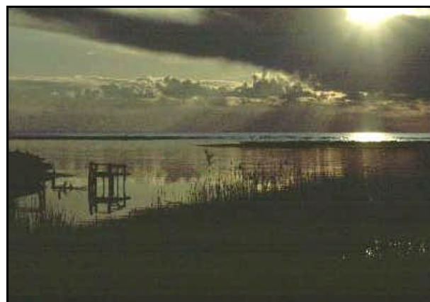
Foce del fiume Ombrone