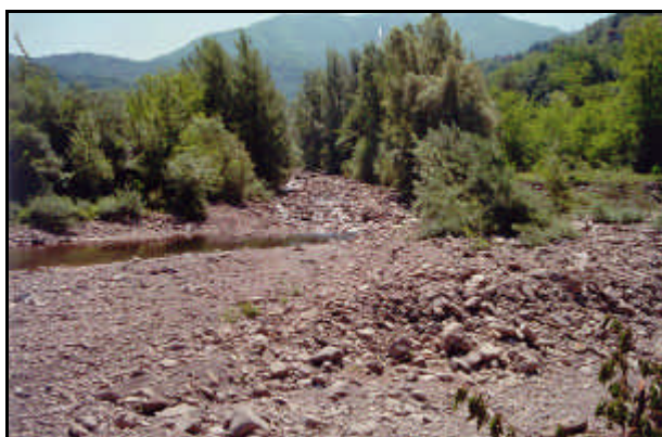
Sorgente del fiume Ombrone

Nasce sul versante sud-orientale dei Monti del Chianti presso S. Gusmè e, dopo un corso molto articolato di 161 km attraverso valli anche strette e profonde, sfocia nel Mar Tirreno a Sud-Ovest di Grosseto. I suoi affluenti di destra sono il Torrente Arbia ed il Fiume Merse, mentre quelli di sinistra sono il Fiume Orcia ed altri minori come il Torrente Melacce ed il Torrente Trasubbie. Il fiume Ombrone, con il suo bacino idrografico di 3494 Km 2 , ha la maggiore portata di sedimenti in sospensione dei fiumi toscani. Questo dato può essere spiegato dall'alta erodibilità delle rocce sulle quali il fiume imposta il suo corso, Costituite in buona parte da formazioni plioceniche argilloso-sabbiose. Inoltre il regime pluviometrico è caratterizzato da una marcata stagionalità che provoca, durante le maggiori precipitazioni, profonde erosioni sulle pendici, già dissestate da una secolare opera di disboscamento.