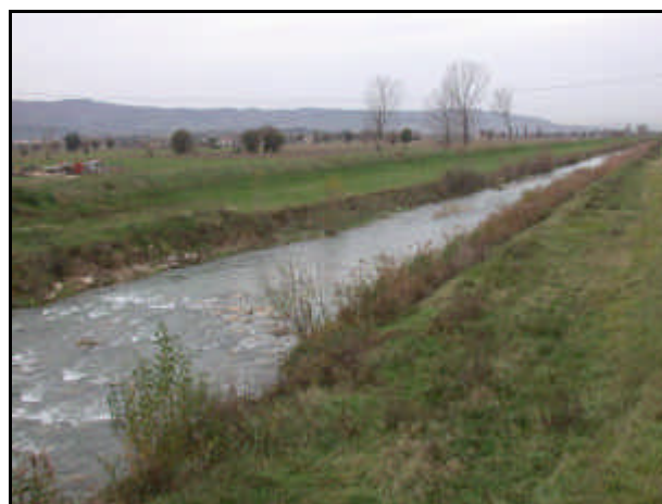
Confluenza con il fiume Topino