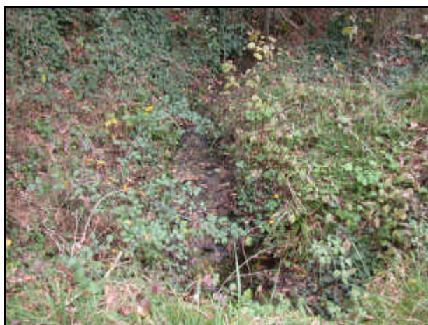
Sorgente del fiume Maroggia

Provincia di Terni e Perugia. Nasce dal monte Vagliamenti (m 936) in provincia di Terni, dove scorre per un breve tratto, passando subito in quella di Perugia. Si unisce al torrente Teverone nella piana fra Foligno e Spoleto. Località: Spoleto.