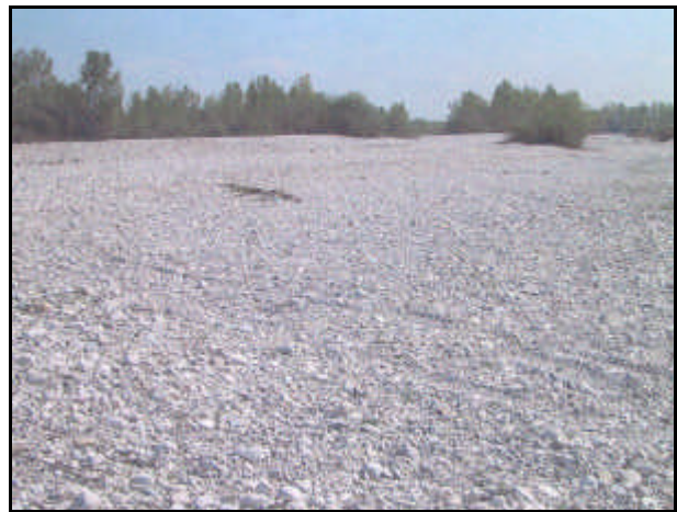
Confluenza nel fiume Meduna