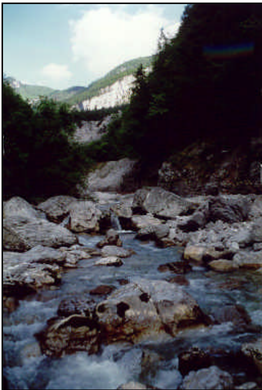
Sorgente del fiume Cellina

Provincia di Udine Nasce dal monte la Gialina (mt.1634). A mt. 402 sbarrato da una diga, forma il lago di Barcis, lungo mt. 4500 e largo 500. Affluente di destra del fiume Meduna presso Vivaro. Costeggiato per gran parte dalla strada San Leonardo Valcellina-Montereale Valcellina-SS. 251. Affluenti, di sinistra: torrente Cimolian, torrente Molassa, torrente Settimana, torrente Varma; di destra: torrente Caltea, torrente Pentina, Torrente Prescudin.