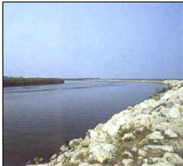
Foce fiume Brenta