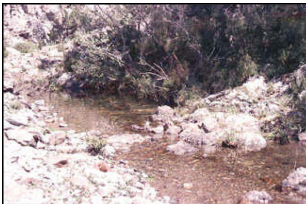
Sorgente fiume Brenta

Il Brenta nasce tra i laghi di Levico e Caldonazzo a 450 m di altitudine ed è lungo quasi 174 km. Nel suo bacino idrografico si possono individuare due parti distinte con una evidente discontinuità tra di loro. Quella montana, infatti, corrispondente grosso modo ai primi 70 km del corso, dall'origine ai pressi di Bassano, è molto estesa ed è attraversata da una fitta rete di affluenti mentre quella meridionale è meno ampia e priva di torrenti importanti. La dispersione sotterranea delle acque, determinata dalla permeabilità dei terreni, riduce la portata del fiume, al suo ingresso nell'alta pianura. Notevole la sottrazione delle acque esercitata dalle rogge. Si riconoscono due periodi di massima (primavera-autunno) e due di minima (primavera- inverno). Il corso del Brenta non si è mantenuto stabile e regolare, nel tempo, ma ha divagato rispetto all'asse dell'alveo di origine, in senso ovest-est. E' uno dei fiumi italiani maggiormente trasformati dall'opera della natura e dagli interventi dell'uomo.