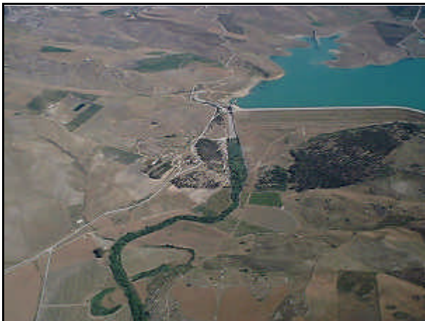
Sorgente del fiume Belice

Fiume della Sicilia sudoccidentale; 77 km. Bacino: 866 km 2 . Ha due rami sorgentiferi: il Belice destro(45,5 km), che nasce presso Piana degli Albanesi, e il Belice sinistro (42 km), che scende dalla Rocca Busambra. Il Belice propriamente detto, lungo 30 km circa, sfocia nel mare di Sicilia a est delle rovine di Selinunte. Nel bacino montano, impianti idroelettrici; nella valle del basso Belice, comprensorio di bonifica. La media valle del fiume fu colpita, nel gennaio 1968, da un terremoto che distrusse completamente numerosi centri, come Gibellina, Montevago, Salaparuta, e provocò molte vittime.