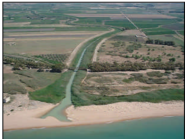
Foce del fiume Belice