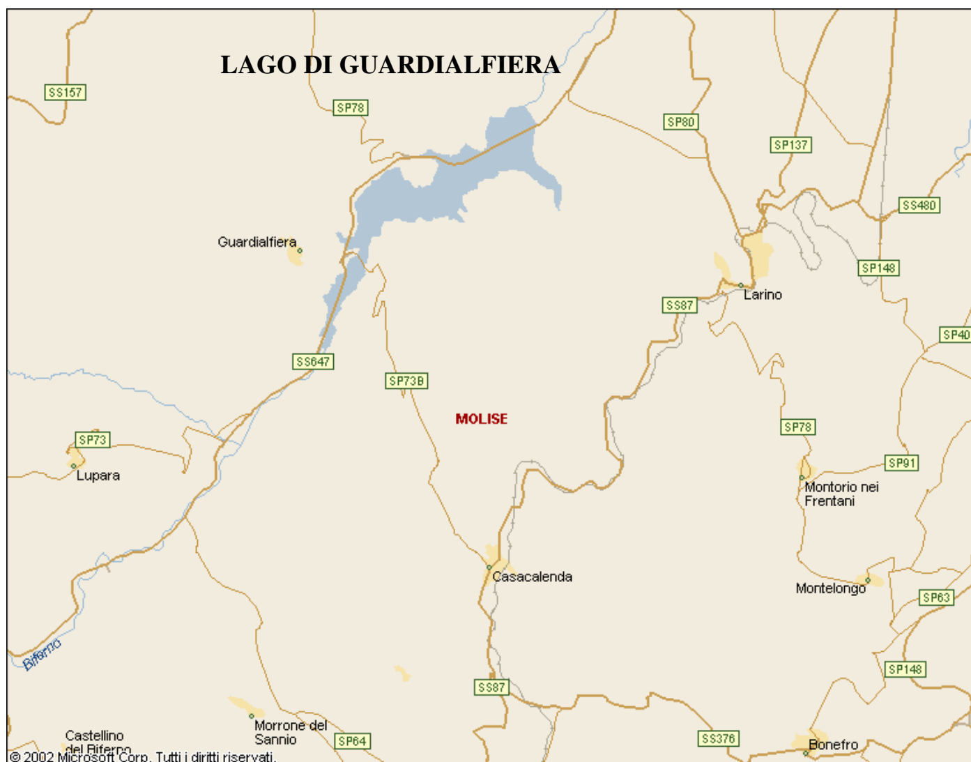
FOTO N. 56: Cartina recante ubicazione geografica del Lago di Guardialfiera.