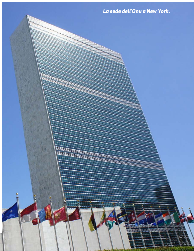
La sede dell'Onu a New York.

Ovviamente, non si può che iniziare tale disamina dalla "Dichiarazione universale dei diritti umani" (coeva della nostra Costituzione, in quanto adottata dall'Assemblea generale delle Nazioni Unite il 10 dicembre 1948) – alla quale, sebbene non produttiva di effetti giuridici vincolanti, viene universalmente riconosciuto valore pa-