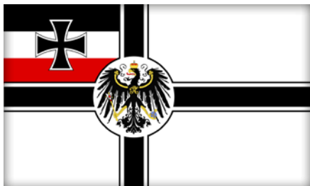
Bandiera del II Reich.

Tenuto conto del fatto che la casistica di simboli d'odio è davvero vastissima, e che obiettivo di questo paragrafo è più che altro quello di stimolare la curiosità personale e l'interesse professionale dell'operatore in materia, per un ricco database di simboli dell'odio (sia pure focalizzato sul contesto statunitense) si rinvia all'interessante sito dell'ONG ebraica USA Anti-Defamation League ( https://www.adl.org/hate-symbols ).