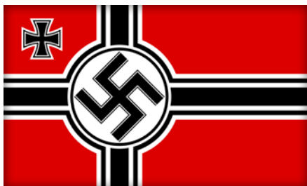
Bandiera del III Reich.