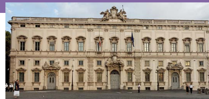
La sede della Corte Costituzionale.

marie informazioni”: ai sensi dell’art. 134, co 4 cpp è sempre consentita la riproduzione audiovisiva delle dichiarazioni della vittima, che deve essere ascoltata con l’ausilio dello psicologo/psichiatra, non deve avere contatti con l’indagato mentre viene sentita e non deve essere chiamata più volte a deporre, salva l’assoluta necessità (art. 351, co 1 ter cpp).