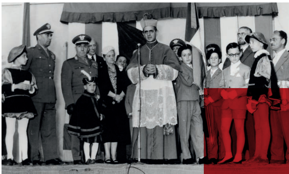
1961 - Il Cardinale Giovanni Battista Montini, futuro Papa Paolo VI, inaugura il collegio di Busnago (MI)