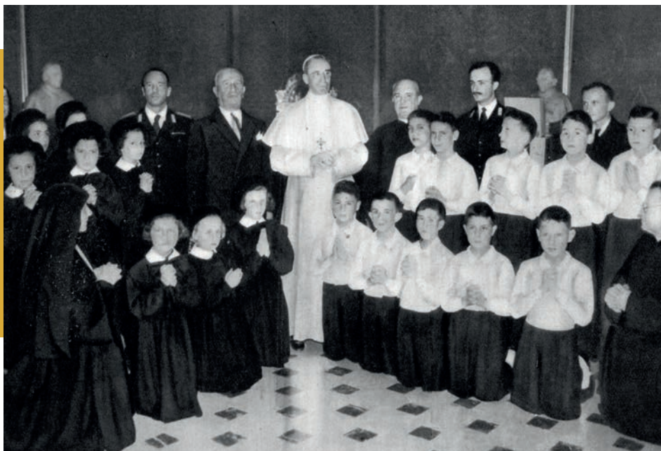
1950 - Sua Santità Pio XII riceve in udienza privata i nostri ragazzi subito dopo l'apertura dei collegi di San Mauro Torinese (TO) e di Mornese (AL)